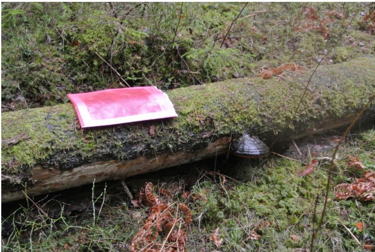
En av de få men mycket artrika lågor