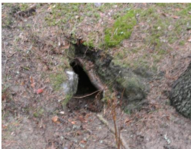
Högstubbar med bohål och rösen med lyor förekommer i området