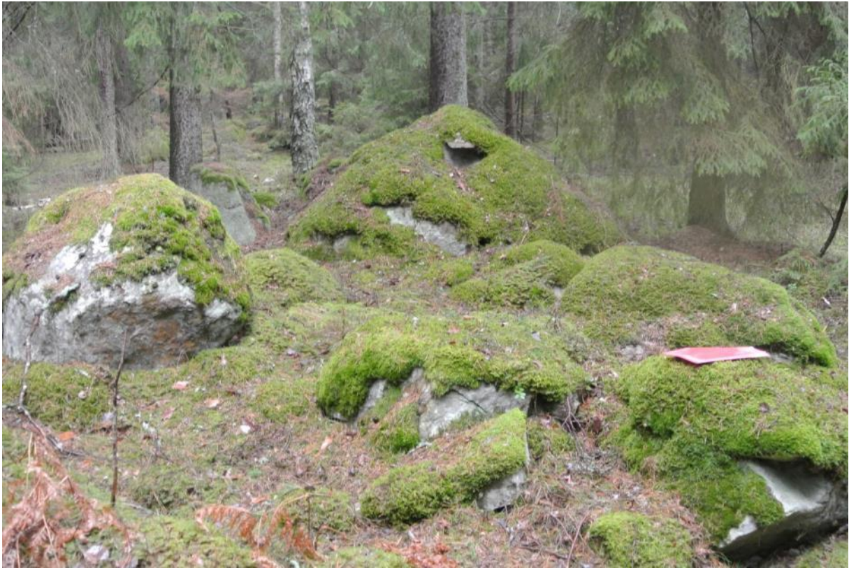
Den bitvis blockrika marken har en mycket rik kryptogamflora men är mycket ömtålig